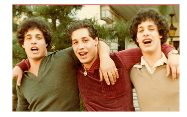
Una scena da Three Identical Strangers

Tre gemelli separati dalla nascita si ritrovano casualmente. Una storia vera che indaga sulle influenze che condizionano la nostra vita.