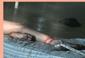
Una scena da Se mi ascolti e mi credi

(Alberto Cavallini, Italia 2017, 57') Un diario crudo, reale, a volte commovente delle pratiche usate nei manicomi prima della legge Basaglia.