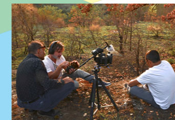
Il set di DentroFuori

Storie di persone dal Centro Diurno del gruppo Reverie. Dentro e fuori dalla malattia, dalla vita, da uno stigma sociale alla scoperta delle emozioni, dei desideri, dell'amore.