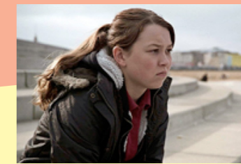
Una scena da Jellyfish